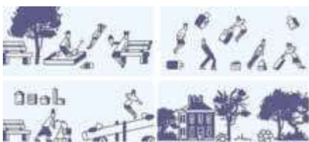
Fokusgruppe 4. Illustrationen: Wernecke