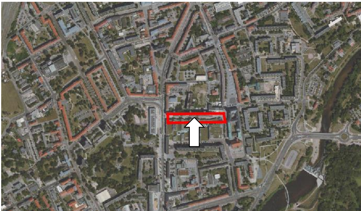
Luftbild (Befliegung 2019)