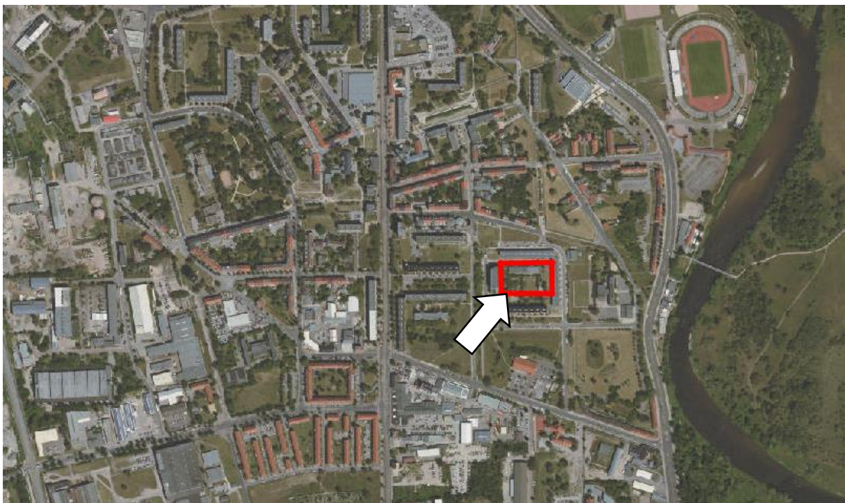
Luftbild (Befliegung 2019)