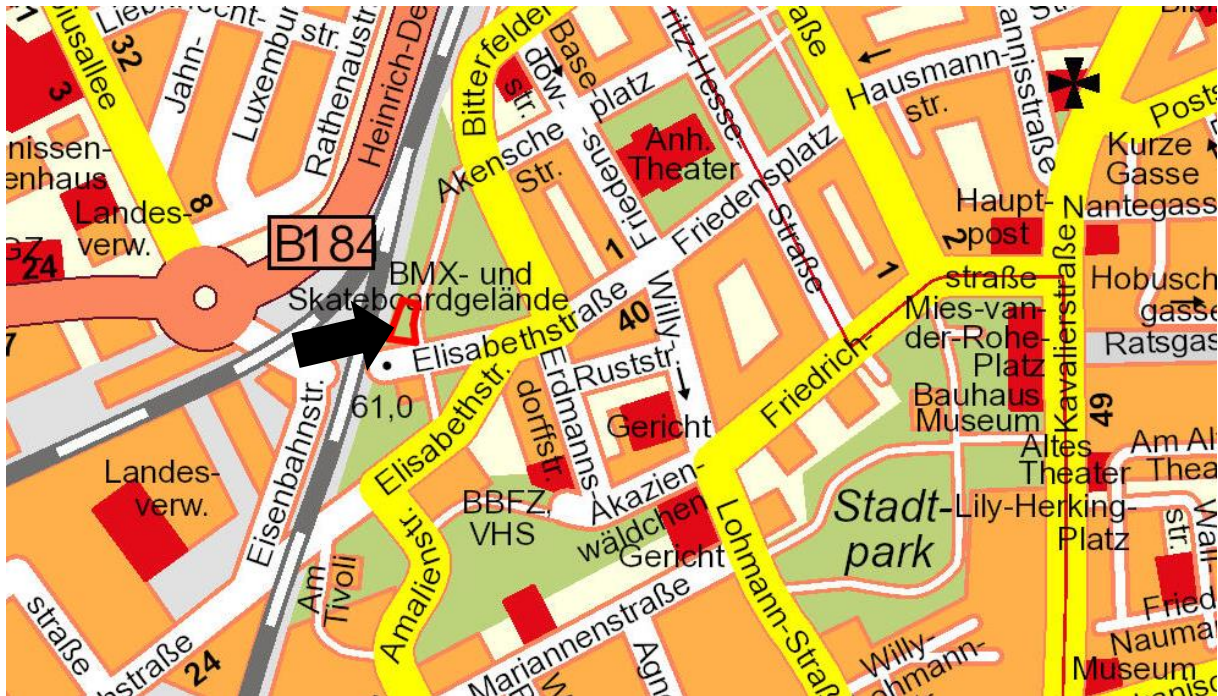
Stadtplan © Stadt Dessau-Roßlau