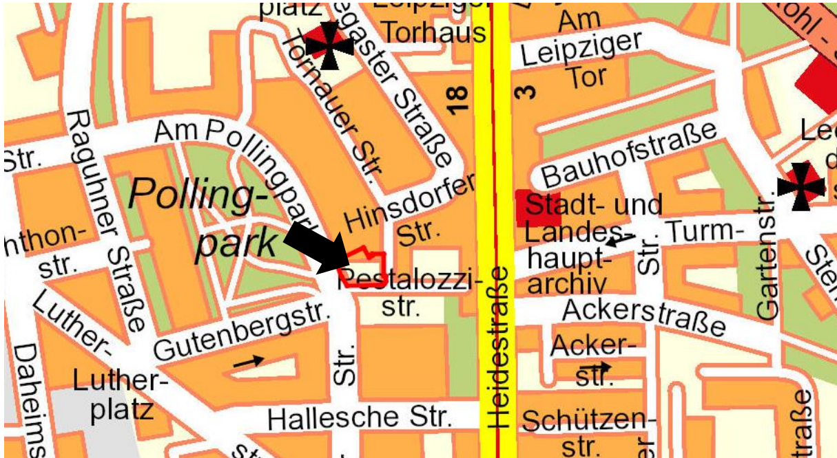
Stadtplan © Stadt Dessau-Roßlau