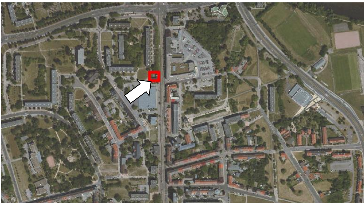
Luftbild (Befliegung 2019)