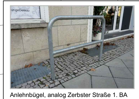
Anlehnbügel, analog Zerbster Straße 1. BA