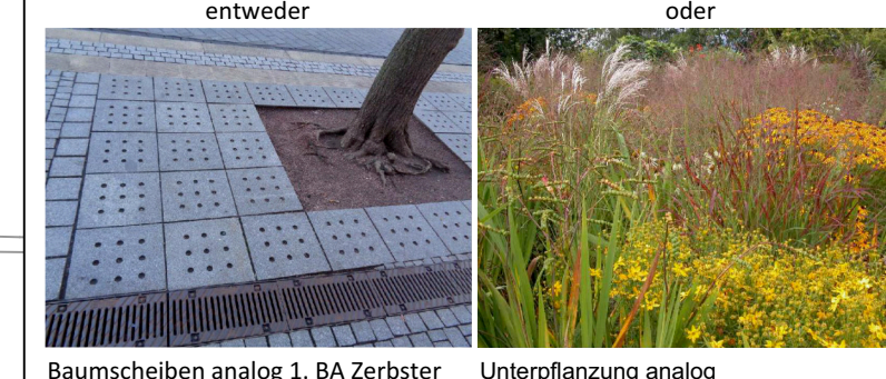
entweder Baumscheiben analog 1. BA Zerbster Straße oder Unterpflanzung analog Kreisverkehr Katholische Kirche