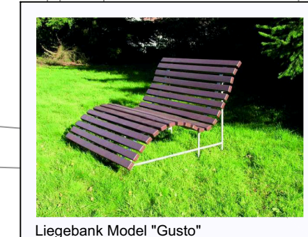
Liegebank Model "Gusto"