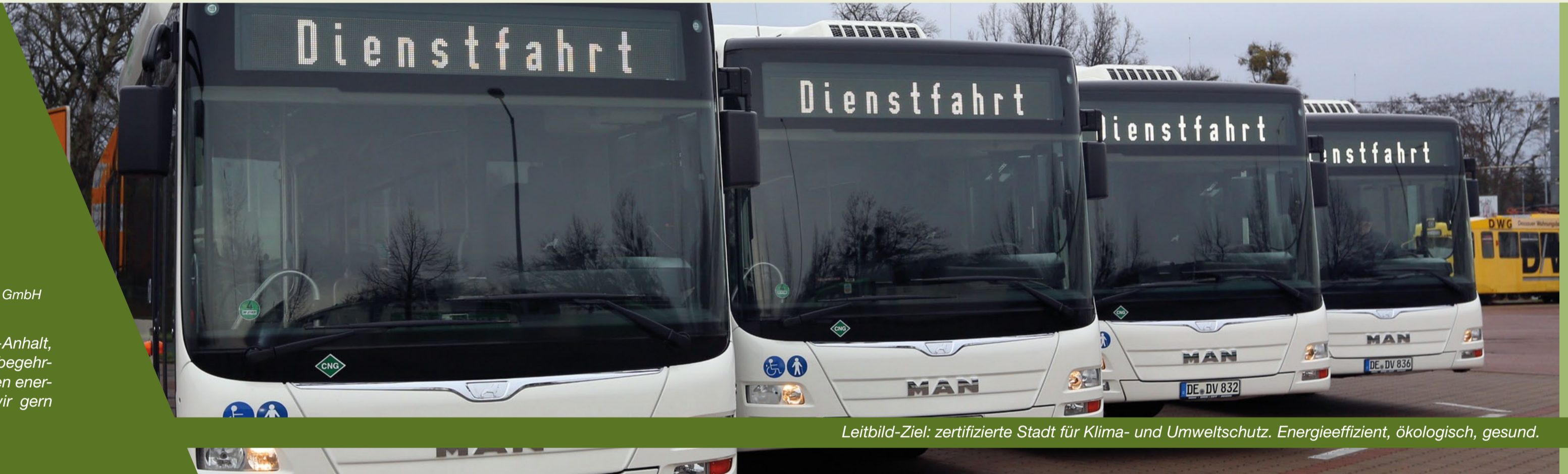
Leitbild-Ziel: zertifizierte Stadt für Klima- und Umweltschutz. Energieeffizient, ökologisch, gesund.

”Dessau-Roßlau ist die erste Kommune in Sachsen-Anhalt, die den European Energy Award (eea) erhielt. Die begehrte Auszeichnung belegt Ihre überdurchschnittlichen energie- und klimapolitischen Anstrengungen, die wir gern auch weiterhin unterstützen.“