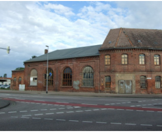
ehem. Langes Konzerthaus