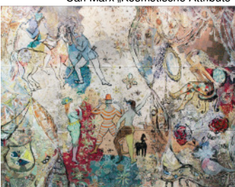
Carl Marx „Kosmetische Attribute“