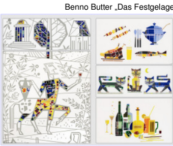
Benno Butter „Das Festgelage“