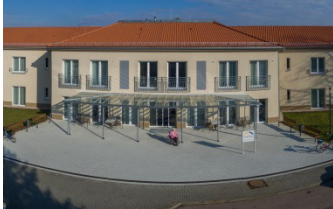
Pflegeheim „Haus an der Rossel“ Wiesenstraße 10 A