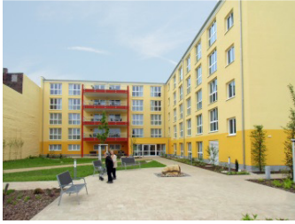
K & S Seniorenresidenz Ferdinand-von-Schill-Straße 7 A