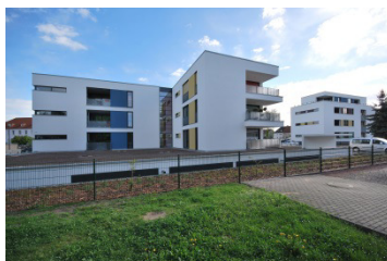
Wohngebäude Liebknechtstraße 10 und 12