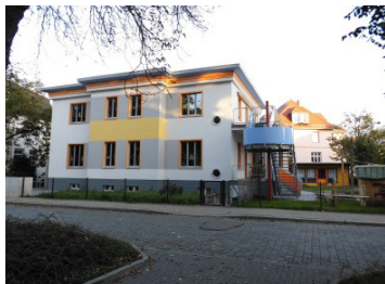
Kinderkrippe „Parkwichtel“ Heinz-Röttger-Straße 10