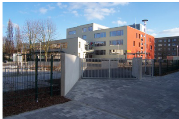
Grundschule/Hort Friederikenstraße 23