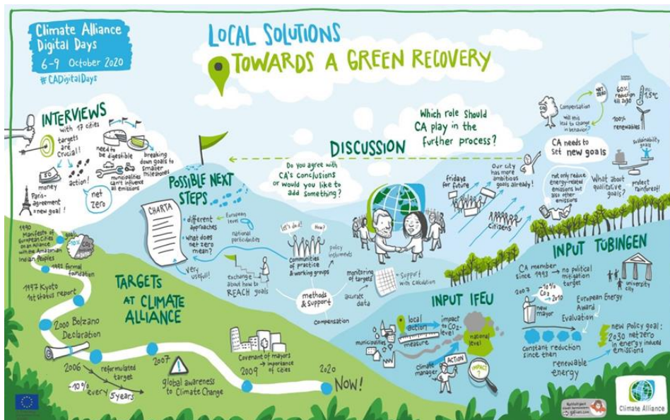
Graphic Recording der Zieldiskussion im Rahmen der Klima-Bündnis Digital Days im Oktober 2020

Dieser Entwurf für eine Klima-Bündnis-Charta erneuert im Lichte dieser Entwicklungen die bestehende Selbstverpflichtung für eine „kontinuierliche Reduktion der Treibhausgasemissionen“ (Satzung des Klima-Bündnis) und erweitert die Zielsetzung zu einem Zielkorridor, der die Mitglieder des Klima-Bündnis bei ihren lokalen Klimaschutzstrategien unterstützen soll.