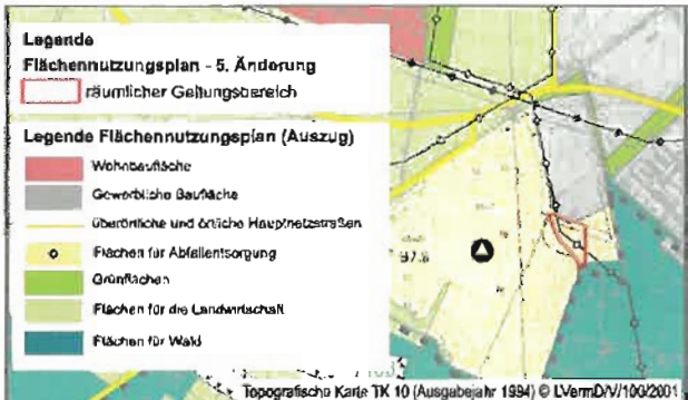
Lage der 5. Änderung und bisherige Darstellung im 2004 genehmigten Flächennutzungsplan (M 1:20.000)