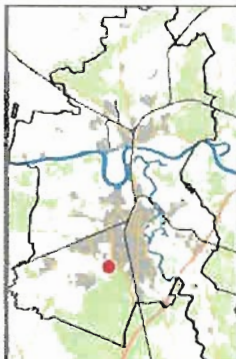
Lage der 5. Änderung in Dessau-Roßlau