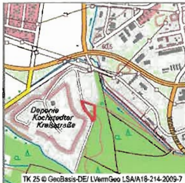
Lage der 5. Änderung im Stadtteil (M 1:25.000)