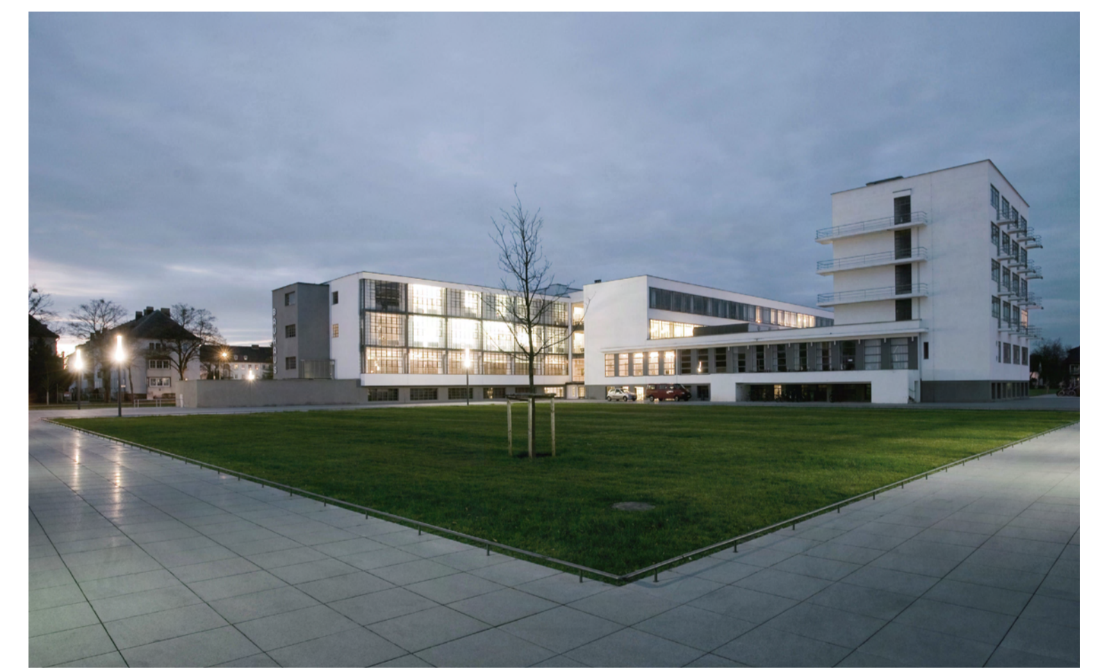
Große Rasenfläche vor dem Bauhaus