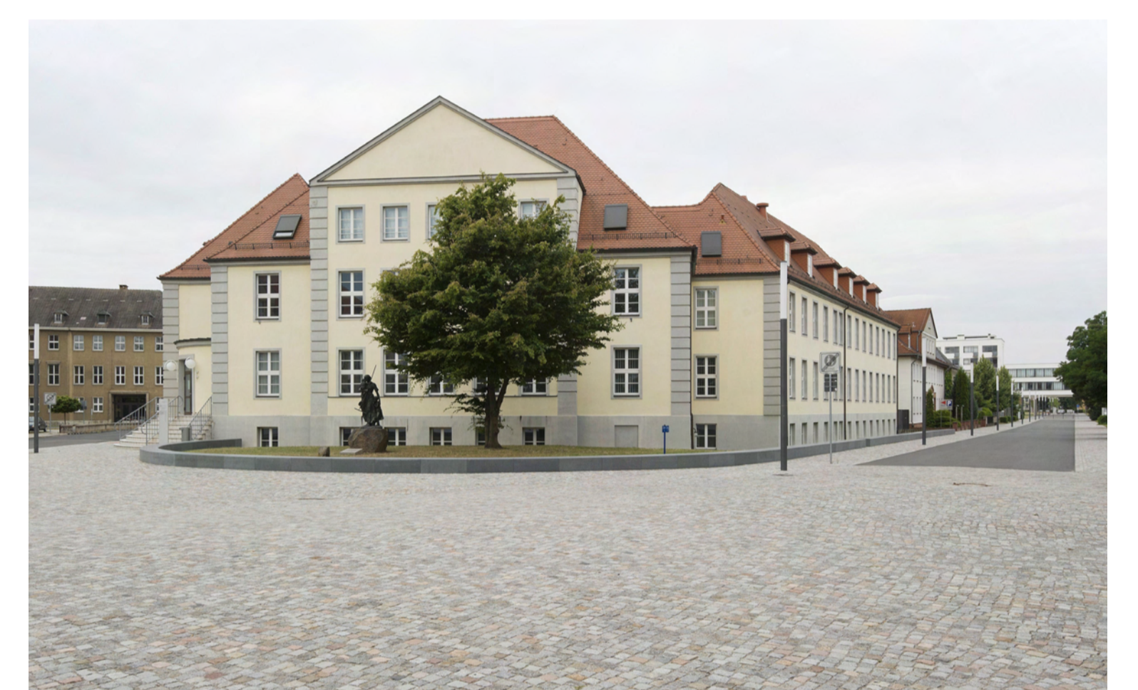
Blick Richtung Bauhaus vom Seminarplatz