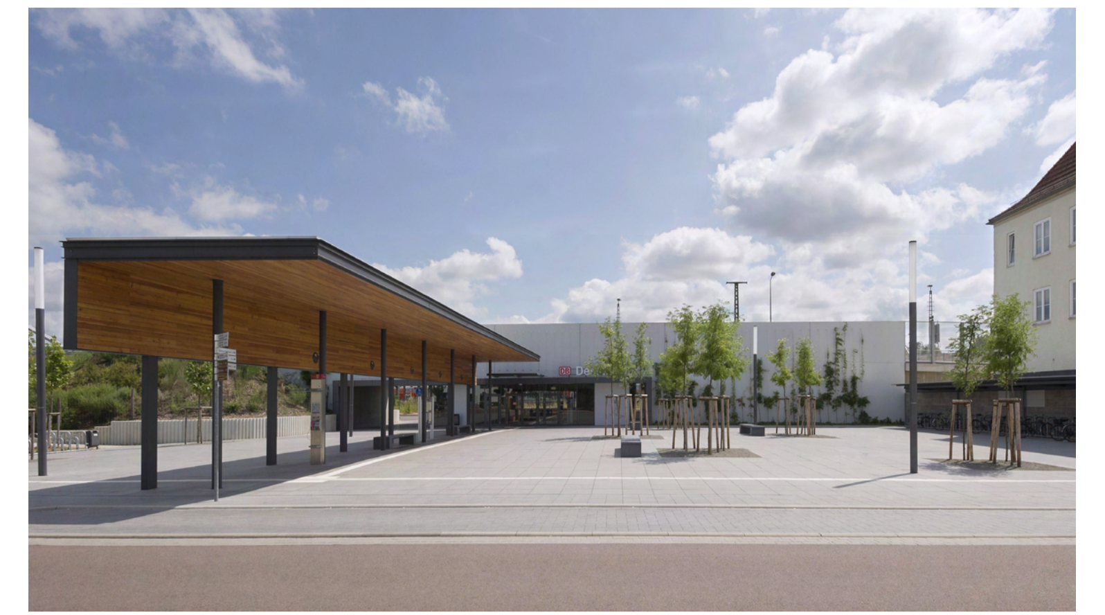
Vorplatz Westausgang Hauptbahnhof

Grafik: MANN LANDSCHAFTSARCHITEKTUR, Fulda