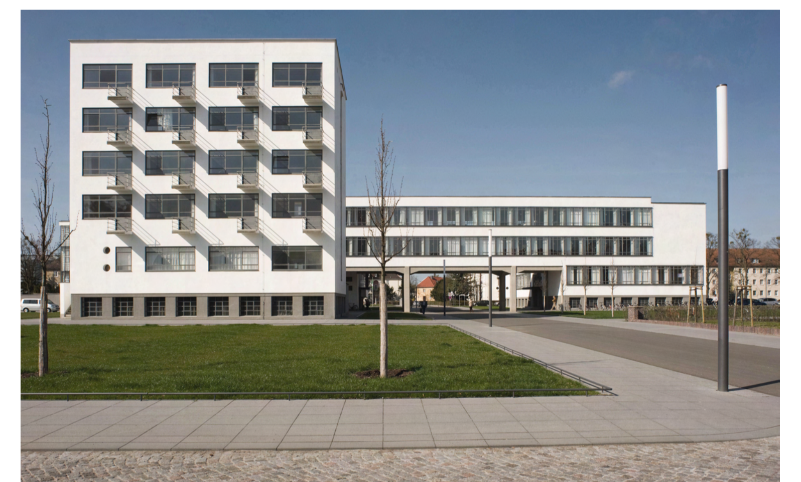
Ansicht Bauhaus von Westen