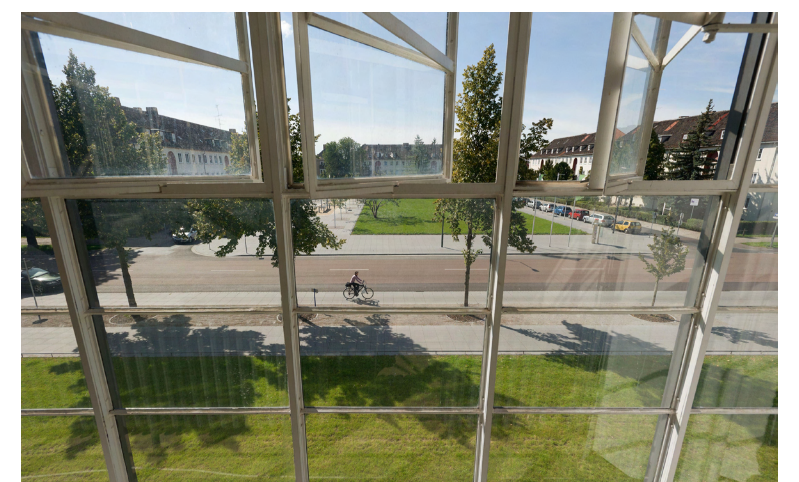
Blick aus dem Bauhaus auf den Bauhausplatz