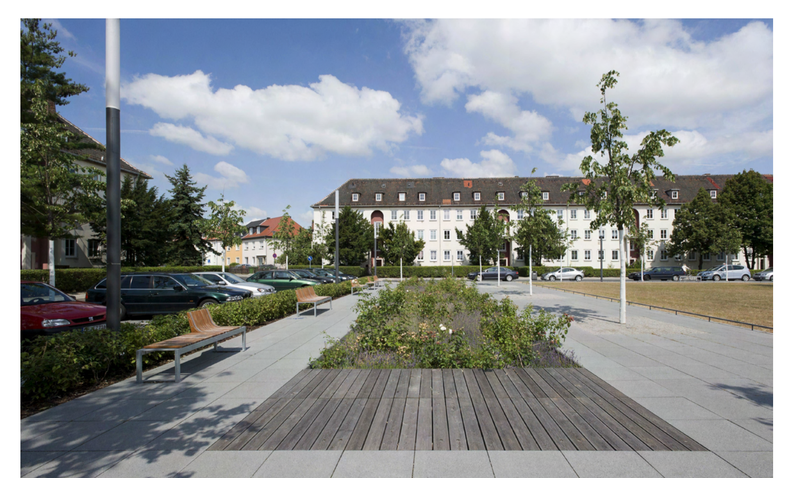
Westliches Ende des Bauhausplatzes