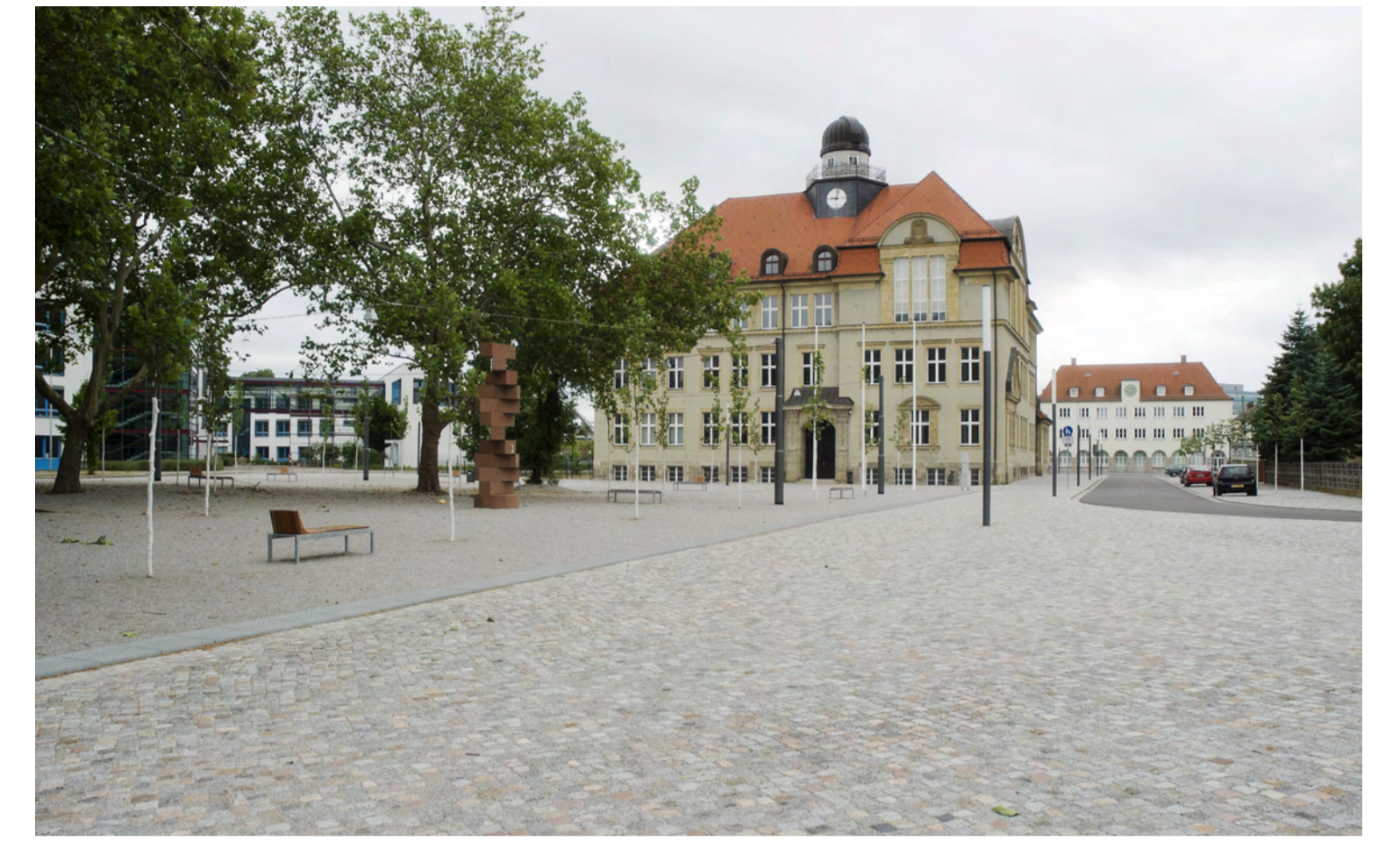
Schwabestraße mit Blick Richtung Bahnhof