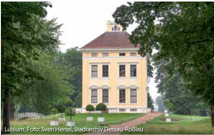
Luisium, Foto: Sven Hertel, Stadtarchiv Dessau-Roßlau