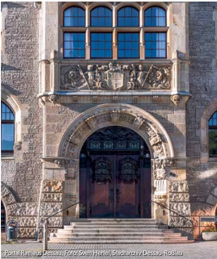
Portal Rathaus Dessau