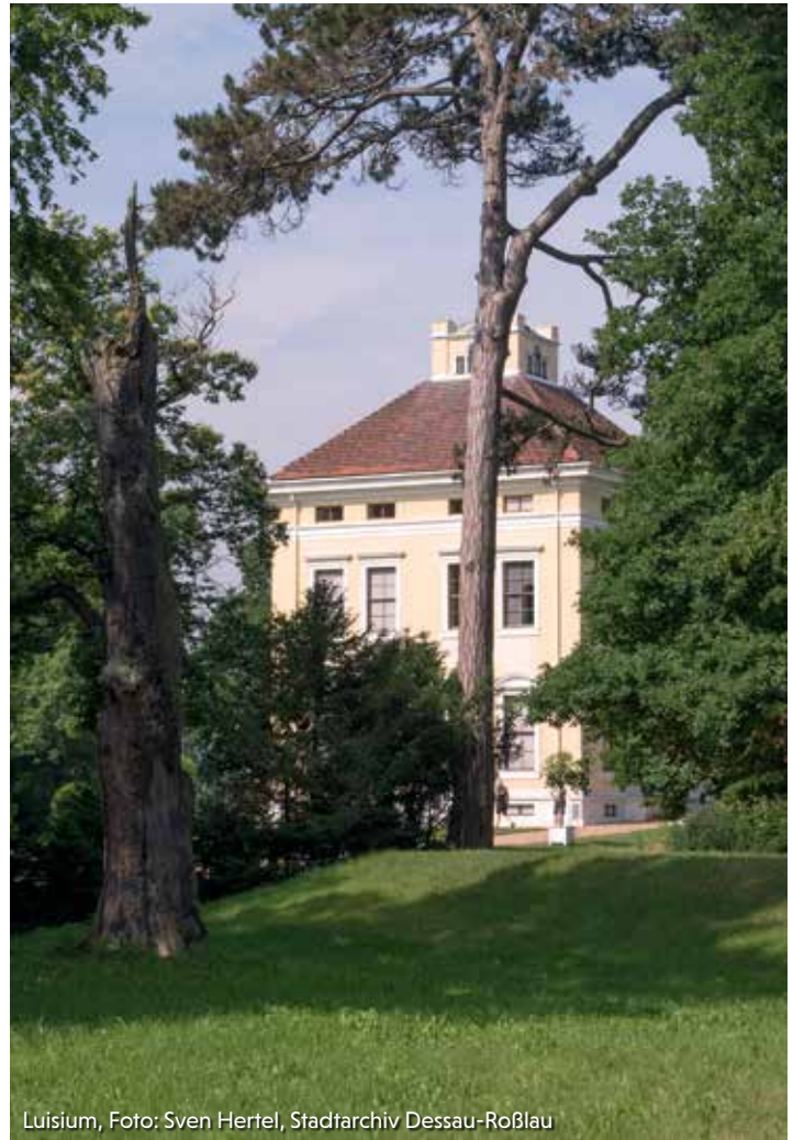
Luisium

Wenn Sie länger in Dessau-Roßlau verweilen, erwartet Sie noch viel mehr, denn Dessau als ehemalige Residenzstadt des Landes Anhalt ist reich an Traditionen. Der Philosoph Moses Mendelssohn, der Dichter Wilhelm Müller und der Komponist Kurt Weill wurden hier geboren. Oechelhaeuser baute in dieser Stadt die ersten Gasmotoren und Hugo Junkers das