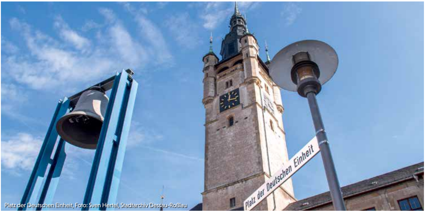
Platz der Deutschen Einheit