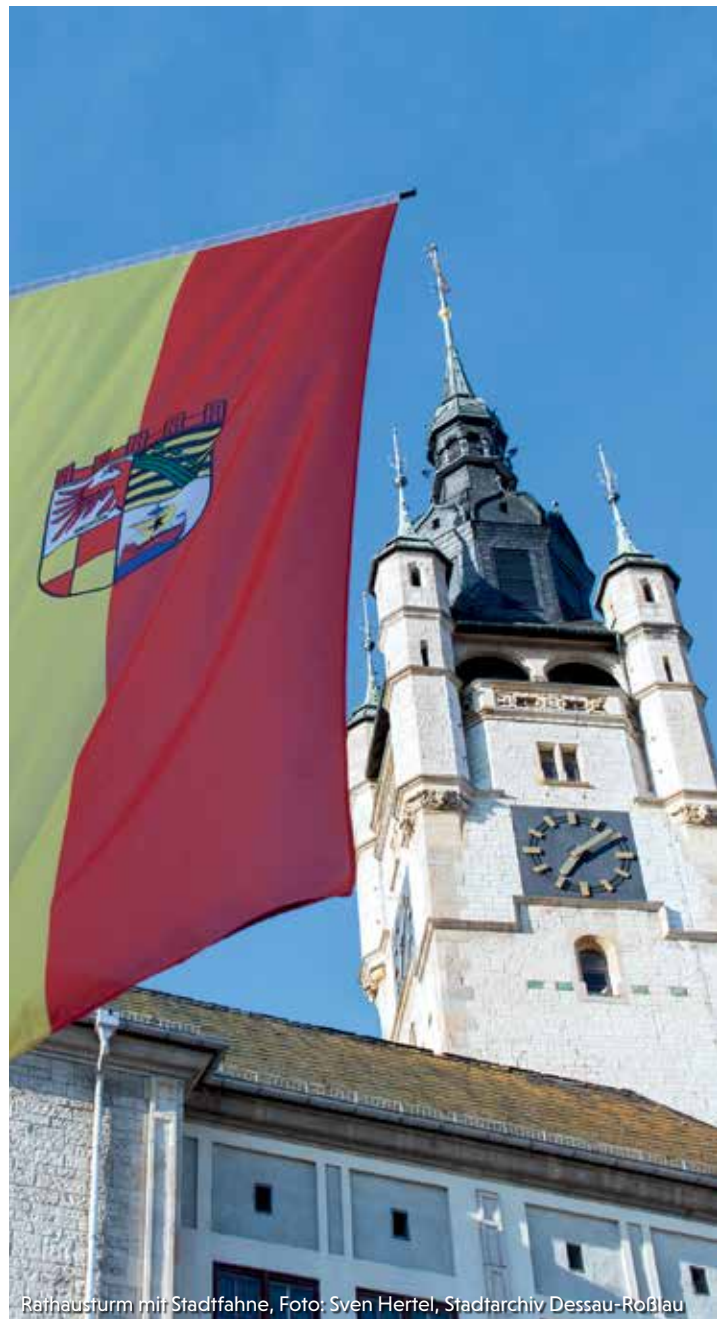
Rathausurm mit Stadtfahne