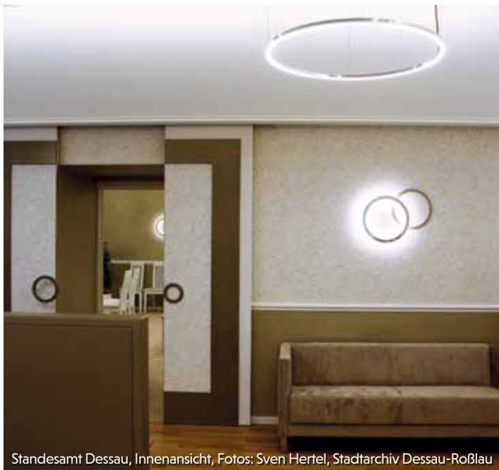
Standesamt Dessau, Innenansicht, Fotos: Sven Hertel, Stadtarchiv Dessau-Roßlau