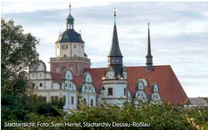
Stadtansicht, Foto: Sven Hertel, Stadtarchiv Dessau-Roßlau