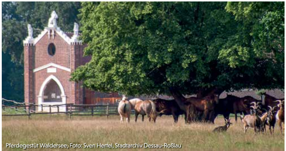
Pferdegestüt Waldersee

Te1.: 0177/5021919 info@feuerwerk- kai-richter.de