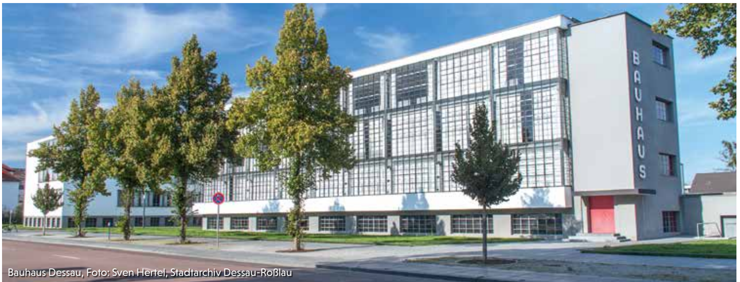
Bauhaus Dessau, Foto: Sven Herrel, Stadtarchiv Dessau-Roßlau

dem Ausspruch „Die Form gehorcht der Funktion“ es weniger romantisch formulierte, werden Sie beim Besuch der Bauhausbauten in Dessau-Roßlau erleben, dass es auch den Bauhauskünstlern und Architekten um die zeitgemäße Verbindung von Schönem und Zweckmäßigem ging. Das Bauhaus zählt zu den wichtigsten Architekturdenkmälern des 20. Jahrhunderts, und in den Meisterhäusern lebten und arbeiteten so bedeutende Künstler wie Kandinsky, Klee und Feininger. Das 2019 eröffnete Bauhaus Museum und weitere Bauhausbauten befinden sich im Stadtgebiet. Museen und Galerien mit ihren Schätzen laden zum Besuch ein, ein großes Repertoire bietet das Anhaltische Theater. Ältestes Gebäude im Stadtteil Roßlau ist die fast 1.000-jährige Wasserburg, die zeitweise Witwensitz der Fürsten von Anhalt war. Auf dem Burggelände ließ Fürst Johann August von Anhalt-Zerbst 1740 ein Jagdschloss erbauen. Die Forsten rund um Roßlau gehörten zu den beliebtesten Jagdrevieren der Anhaltiner. Noch heute besteht die Gemarkung Roßlau zu 45 Prozent aus Wald. Die bis vor kurzem noch dem Verfall preisgegebene Burg wurde 1836 – 1838