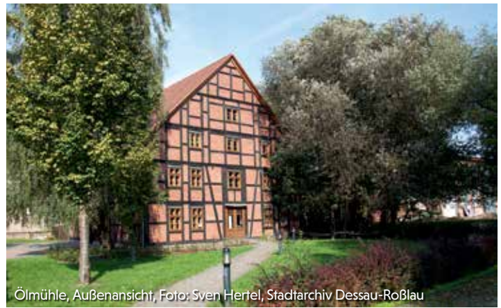
Ölmühle, Außenansicht, Foto: Sven Hertel, Stadtarchiv Dessau-Roßlau