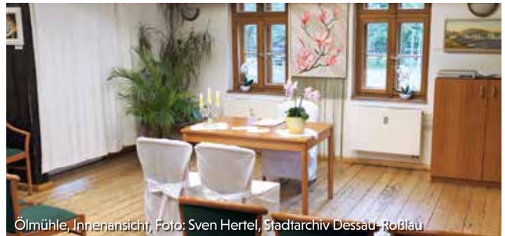
Ölmühle, Innenansicht, Foto: Sven Hertel, Stadtarchiv Dessau-Roßlau